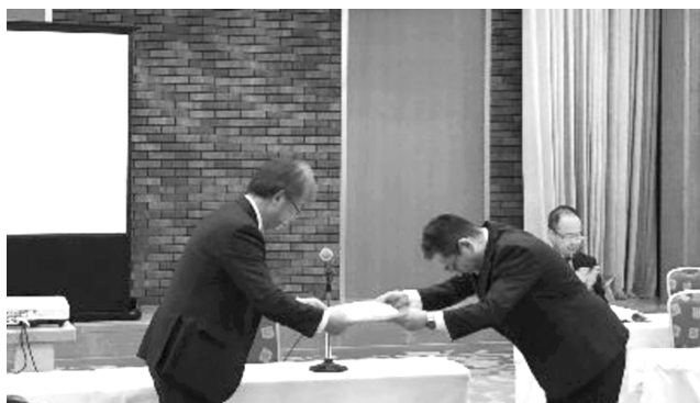
5名の方に感謝状贈呈